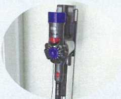
ダイソン掃除機 掃除機スタンド