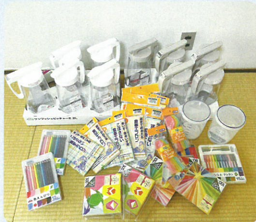
イオンの黄色いレシートキャンペーン

写真の他に無線ルーター、体温計、血圧計、折りたたみテーブル、かき氷機、アリエールジェルボール等々沢山の寄贈品を保護者会より頂きました。