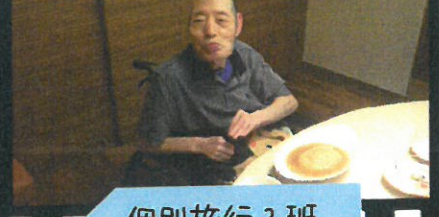
個別旅行 3 班