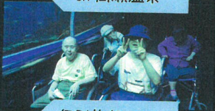
個別旅行 3 班