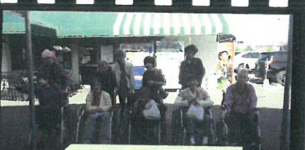
白帰リ旅行 3 班