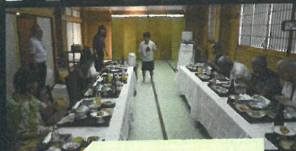
白帰リ旅行 2 班