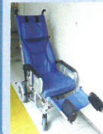
リクライニング車椅子 (アークバル様)