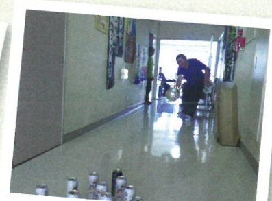
通所部ボーリング大会