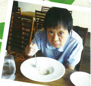
G H 合同余暇支援